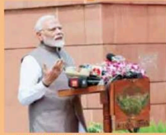
பத்திரிக்கையின் முதல் பக்க கட்டுரை

வெளியீட்டாளர்: இந்திய விவசாயிகள் உர கூட்டுறவு லிமிடெட். அச்சுப்பொறி: ராயல் பிரஸ், பி-81, ஓக்லா இண்டஸ்ட்ரியல் ஏரியா, பேஸு-1, புது தில்லி-110020