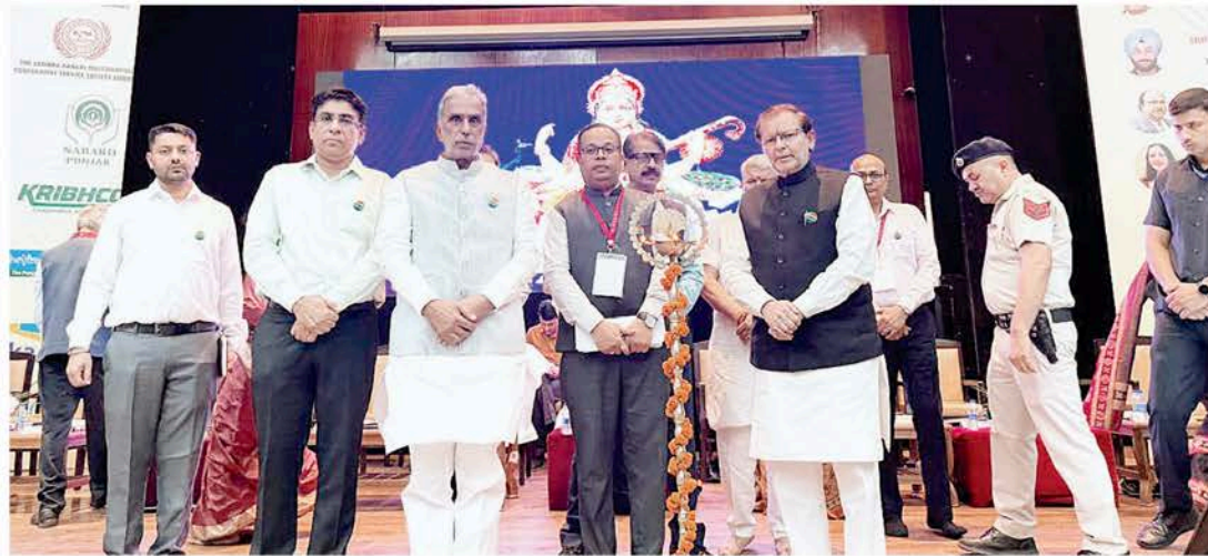
ਸਹਿਕਾਰ ਉਦਯੋਗ ਟੀਮ

ਸਹਿਕਾਰੀ ਸਭਾਵਾਂ ਦੇ ਡਿਜੀਟਾਈਜ਼ੇਸ਼ਨ ਵੱਲ ਵਿਸ਼ੇਸ਼ ਧਿਆਨ ਦਿੱਤਾ ਜਾ ਰਿਹਾ ਹੈ ਤਾਂ ਜੋ ਉਨ੍ਹਾਂ ਨੂੰ ਪਾਰਦਰਸ਼ੀ, ਪ੍ਰਭਾਵਸ਼ਾਲੀ ਅਤੇ ਤਕਨੀਕੀ ਤੌਰ 'ਤੇ ਸਮਰੱਥ ਬਣਾਇਆ ਜਾ ਸਕੇ। ਇਸ ਰਾਹੀਂ, ਨਾ ਸਿਰਫ਼ ਸਹਿਕਾਰੀ ਸੰਸਥਾਵਾਂ ਦੇ ਕੰਮਕਾਜ ਨੂੰ ਡਿਜੀਟਲ ਤੌਰ 'ਤੇ ਸਸ਼ਕਤ ਬਣਾਇਆ ਜਾ ਰਿਹਾ ਹੈ, ਬਲਕਿ ਜਲਦੀ ਹੀ ਉਨ੍ਹਾਂ ਦਾ ਔਨਲਾਈਨ ਆਡਿਟ ਸ਼ੁਰੂ ਕਰਨ ਦੇ ਯਤਨ ਵੀ ਕੀਤੇ ਜਾ ਰਹੇ ਹਨ। ਕੇਂਦਰੀ ਸਹਿਕਾਰਤਾ ਰਾਜ ਮੰਤਰੀ ਸ਼੍ਰੀ ਕ੍ਰਿਸ਼ਨ ਪਾਲ ਗੁਰਜਰ ਨੇ ਹਾਲ ਹੀ ਵਿੱਚ ਹਰਿਆਣਾ ਵਿੱਚ ਸਹਿਕਾਰੀ ਸਭਾਵਾਂ ਦੇ ਡਿਜੀਟਾਈਜ਼ੇਸ਼ਨ ਅਤੇ ਵਿਸਤਾਰ ਦੀ ਪ੍ਰਗਤੀ 'ਤੇ ਚੰਡੀਗੜ੍ਹ ਵਿੱਚ ਇੱਕ ਸਮੀਖਿਆ ਮੀਟਿੰਗ ਕੀਤੀ ਜਿਸ ਵਿੱਚ ਉਨ੍ਹਾਂ ਮੁੱਦਿਆਂ 'ਤੇ ਚਰਚਾ ਕੀਤੀ ਗਈ। ਇਸ ਦੇ ਨਾਲ ਹੀ, ਉਨ੍ਹਾਂ ਨੇ 'ਮੇਰੀ ਸਮਿਤੀ ਮੇਰਾ ਪਟਲ' ਨਾਮ ਦਾ ਇੱਕ ਪੋਰਟਲ ਵੀ ਲਾਂਚ ਕੀਤਾ। ਇਹ ਪੋਰਟਲ ਸਹਿਕਾਰੀ ਸਭਾਵਾਂ ਦੀਆਂ ਚੁਣੌਤੀਆਂ ਨੂੰ ਹੱਲ ਕਰਨ ਵਿੱਚ ਮਦਦਗਾਰ ਹੋਵੇਗਾ।