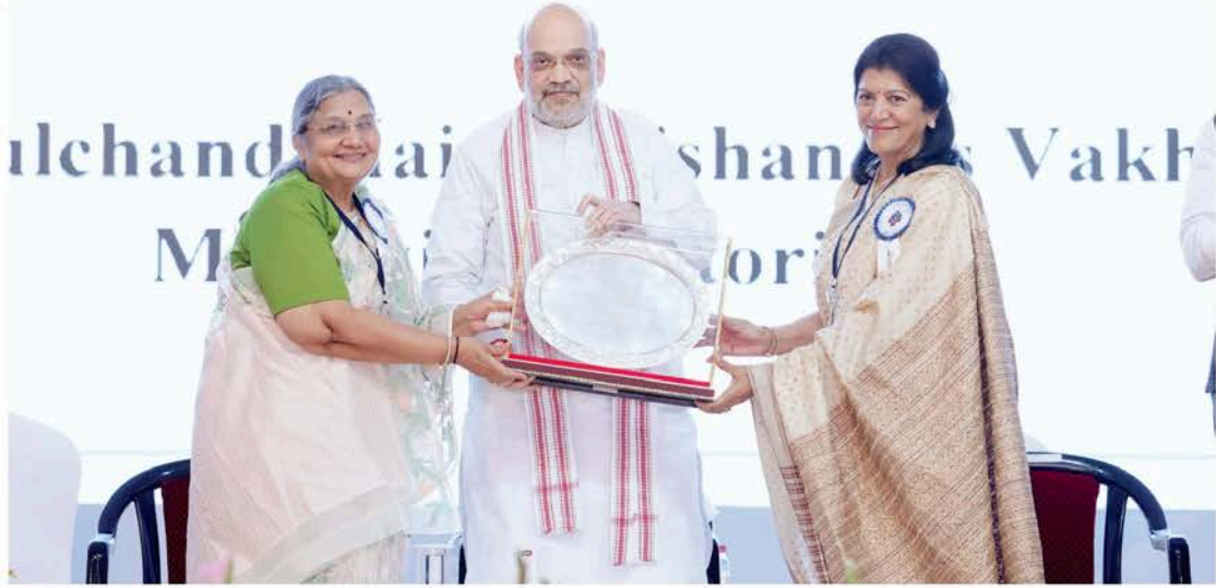
সহকাৰ উদয় টিম

প্ৰধানমন্ত্ৰীয়ে শ্ৰী নৰেন্দ্ৰ মোদীৰ নেতৃত্বত চৰকাৰ স্বাস্থ্য খণ্ডত উল্লেখযোগ্য ইতি-বাচক পৰিৱৰ্তন সাধন কৰিছে। প্ৰতিটো ঘৰতে শৌচালয় নিৰ্মাণৰ বাবে স্বচ্ছ ভাৰত অভিযান, যুৱক-যুৱতীসকলৰ মাজত সুস্থতা বৃদ্ধিৰ বাবে ফিট ইণ্ডিয়া অভিযান, শিশুসকলক পুষ্টিৰ খাদ্য প্ৰদানৰ বাবে পোষণ অভিযান, শিশুক টিকাকৰণৰ বাবে মিছন ইন্দ্ৰধনু আৰু বিশুদ্ধ খোৱা পানীৰ উপলব্ধতা নিশ্চিত কৰাৰ বাবে জল জীৱন অভিযান আদিৰ দৰে গুৰুত্বপূৰ্ণ পদক্ষেপ গ্ৰহণ কৰা হৈছে। ইয়াৰ উপৰিও, চৰকাৰ নিয়মীয়া যোগ আৰু খেলো ইণ্ডিয়া পদক্ষেপৰ জৰিয়তে মানুহক শক্তিশালী আৰু সুস্থ শৰীৰ গঢ়ি তুলিবলৈ অনুপ্রাণিত কৰিছে। কেন্দ্ৰীয় গৃহ তথা সমবায় মন্ত্ৰী শ্ৰী অমিত শাহ গুজৰাটৰ চুৰাটত শ্ৰী বাবুলাল বৃণচান্দ শাহ মহাবীৰ ক্যান্সাৰ চিকিৎসালয় আৰু শ্ৰী ফুলচান্দ ভাই জয়কিশান্দাস বাখাৰিয়া স্বাস্থ্য কেন্দ্ৰৰ উদ্বোধনৰ সময়ত এই সাফল্যসমূহৰ ওপৰত আলোকপাত কৰে।