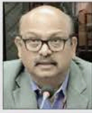
സജീവ കുമ്മാര നായക്