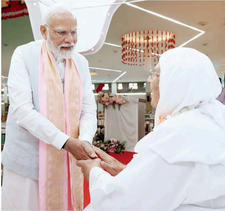
ചന്ദേരി പ്രോത്സാഹിപ്പിക്കുന്നതും, പ്രബുദ്ധരിൽ ഹാൻഡ്സ് ഓപ്പറേഷൻ ഗ്രാമം സ്ഥാപിക്കുന്നതും ഹാൻഡ്സ് ഓപ്പറേഷൻ ഈ