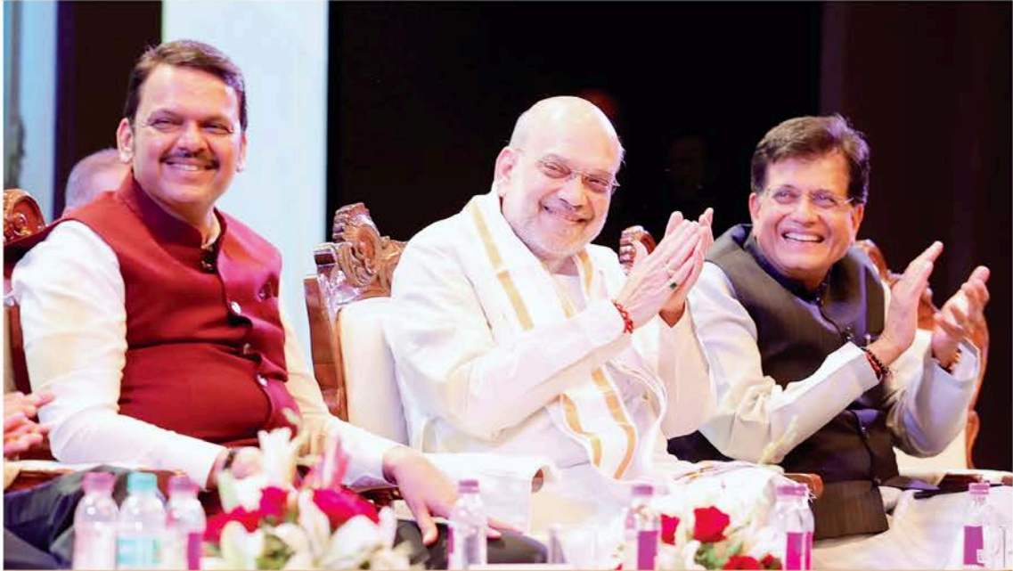
ശ്രീ അമിത് ഷാ മുംബൈയിൽ നടന്ന ഗുജറാത്തി സാഹിത്യ പരിപാടിയിൽ സംസാരിക്കുന്നു.