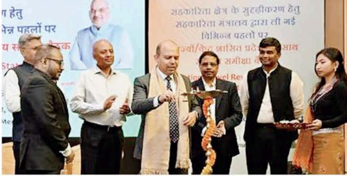
સહકાર ઉદય ટીમ