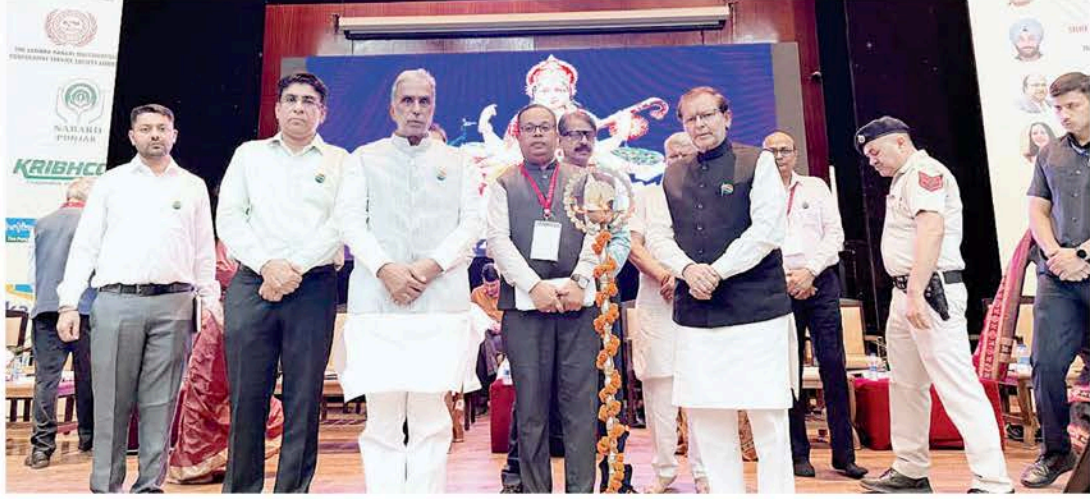
સહકાર ઉદય ટીમ

સહકારી સમિતિઓને પારદર્શક, અસરકારક અને તકનીકી રીતે સશક્ત બનાવવા માટે તેમના ડિજિટલાઇઝેશન પર ખાસ ધ્યાન આપવામાં આવી રહ્યું છે. આના માધ્યમથી સહકારી સંસ્થાઓના કામકાજને માત્ર ડિજિટલ રીતે સશક્ત બનાવવામાં આવી રહ્યું નથી, પણ સાથે-સાથ એ પણ પ્રયત્ન કરવામાં આવી રહ્યો છે કે ટૂંક સમયમાં તેમની ઓડિટિંગ પણ ઓનલાઇન થવા લાગે. કેન્દ્રિય સહકારિતા રાજ્યમંત્રી શ્રી કૃષ્ણ પાલ ગુજરે ગયા કેટલાક દિવસો પહેલાં ચંડીગઢમાં હરિયાણામાં સહકારી સમિતિઓના ડિજિટલાઇઝેશન અને વિસ્તારની પ્રગતિ અંગે સમીક્ષા બેઠક યોજી હતી જેમાં આ મુદ્દાઓ પર ચર્ચા કરવામાં આવી હતી. સાથે જ, તેમણે 'મારી સમિતિ મારો પટલ' નામે એક પોર્ટલ પણ લોન્ચ કર્યું હતું. આ પોર્ટલ સહકારી સમિતિઓને પડતી પડકારોને ઉકેલવા માટે મદદરૂપ સાબિત થશે.