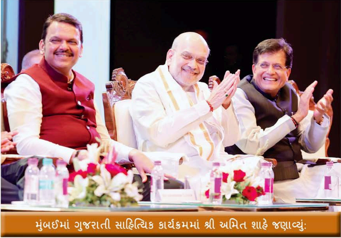
મુંબઈમાં ગુજરાતી સાહિત્યિક કાર્યક્રમમાં શ્રી અમિત શાહે જણાવ્યું: