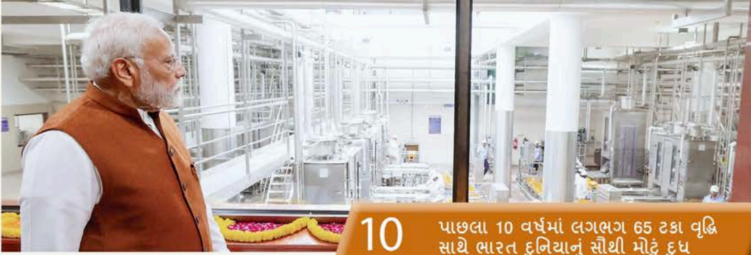
સહકાર ઉદય ટીમ