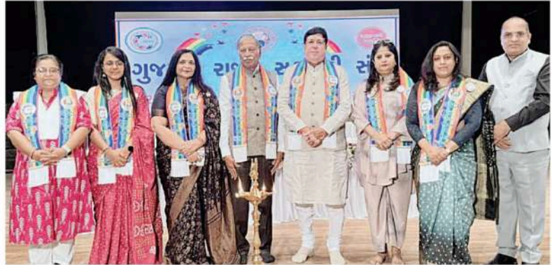
■ ഗുജറാത്ത് സ്റ്റേറ്റ് കോഓപ്പറേറ്റീവ് യൂണിയൻ വനിതാ നേതൃത്വത്തിലുള്ള സഹകരണസംഘങ്ങളെക്കുറിച്ചുള്ള സംസ്ഥാനതല സെമിനാർ സംഘടിപ്പിച്ചു